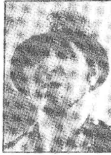
الجنرال محمد أوفقيير

يوم 17 نونبر 1968، فقد رقي إلى درجة ليوتنان جنرال بصحبة زميله ادريس بنعمر رجل الحرب المخلص. فقد حصل هذان الرجلان يوم 16 نونبر 1969 على تشكرات الحسن الثاني عند استقبال فوج أطر جديدة لوزارة الداخلية التي يتحمل مسؤوليتها الجنرال أوفقيير (1).